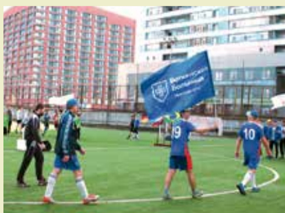
НАША ФОРМУЛА – ЗДОРОВЫЙ ОБРАЗ ЖИЗНИ События – стр. 2