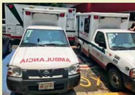
ТРЕМ СТОЛИЦАМ ЕСТЬ ЧЕМ ПОДЕЛИТЬСЯ События – стр. 2