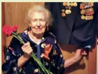
ВОЙНА И МИР Личный пример – стр. 4